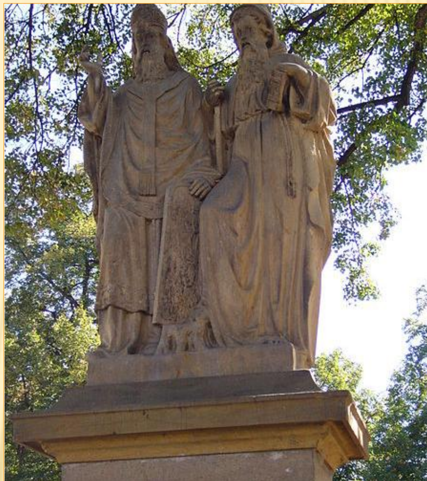
Obr 2: Cyril a Metoděj