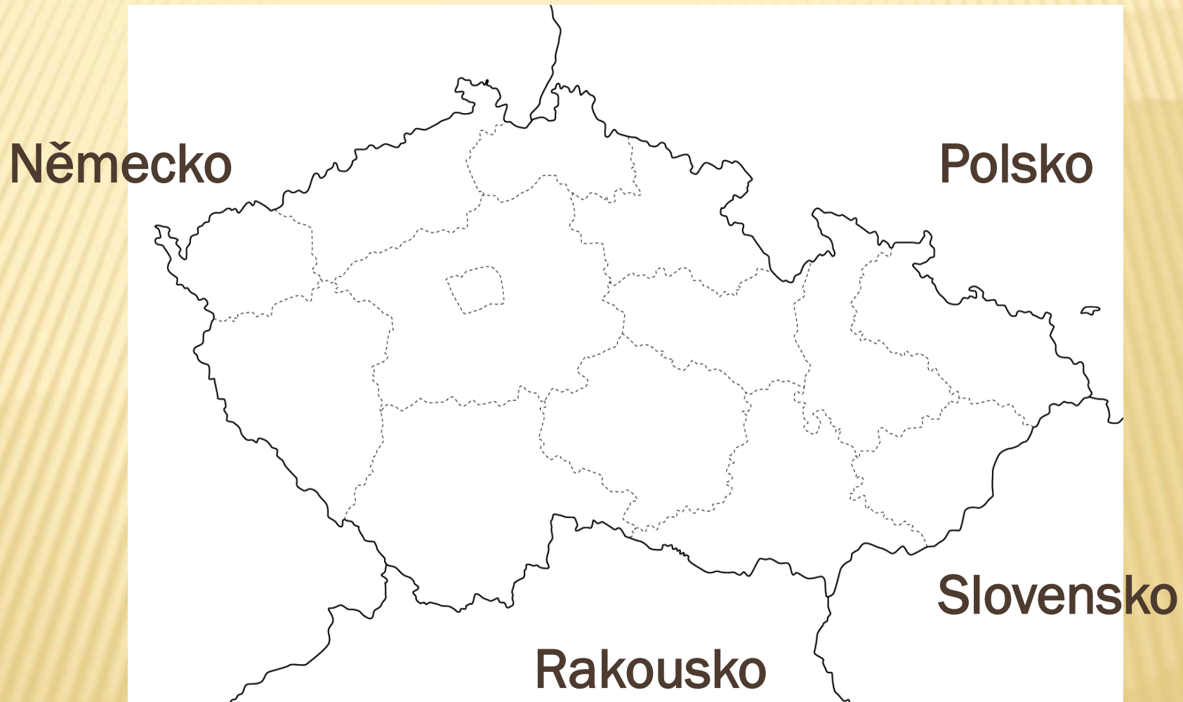
Obr. 1 Slepá mapa ČR