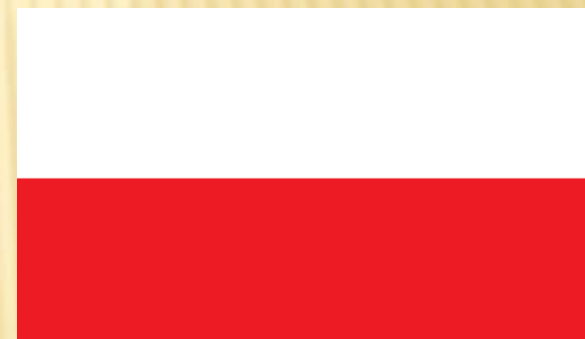
Obr. 2: Původní vlajka ČSR (1918 – 1920)