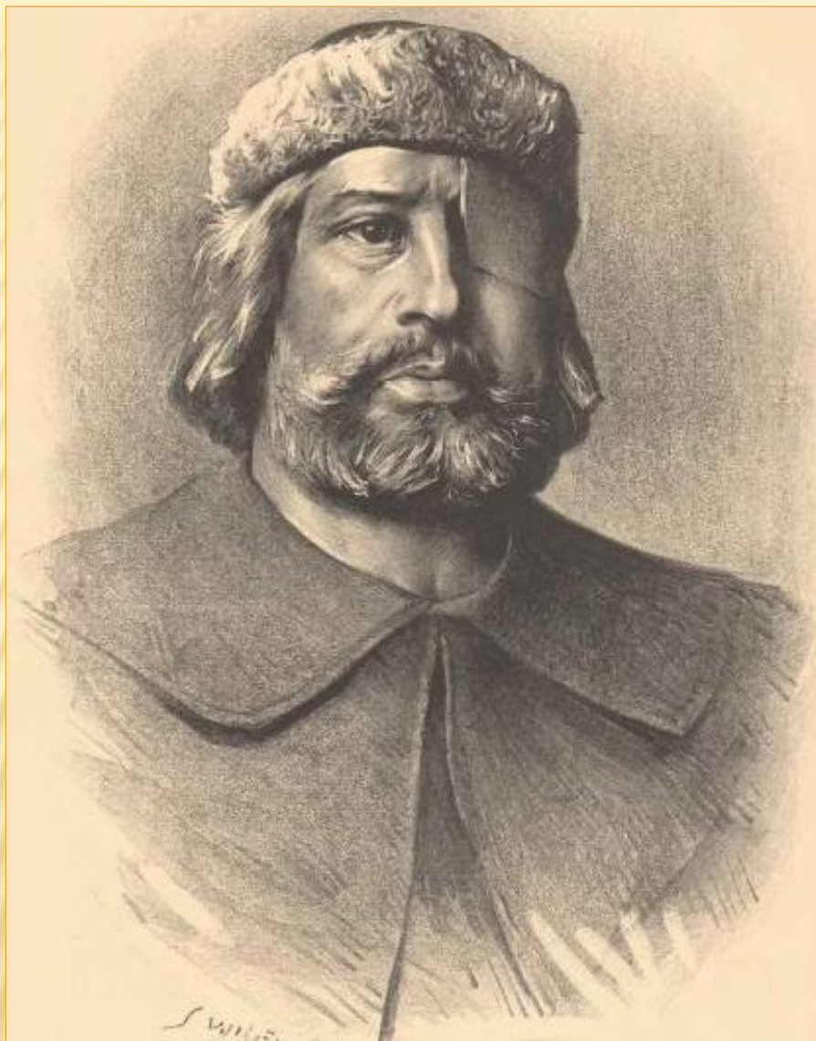
Obr. 2: Podobizna Jana Žižky z Trocnova