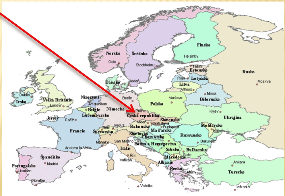
Obr. 1: Mapa Evropy