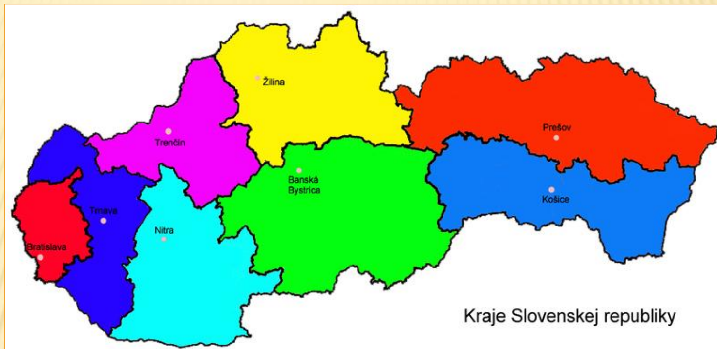
Obr. 8: Mapa krajů Slovenské republiky