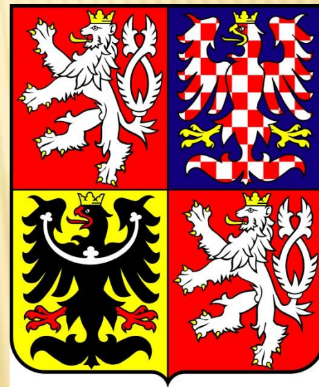
Obr. 5: Velký státní znak