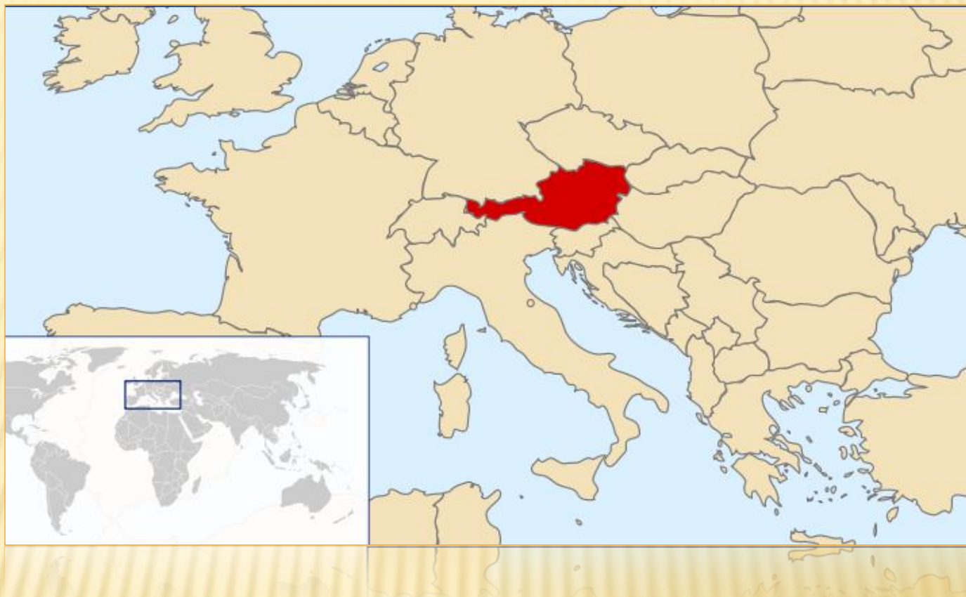
Obr. 7: Mapa Evropy se znázorněným Rakouskem