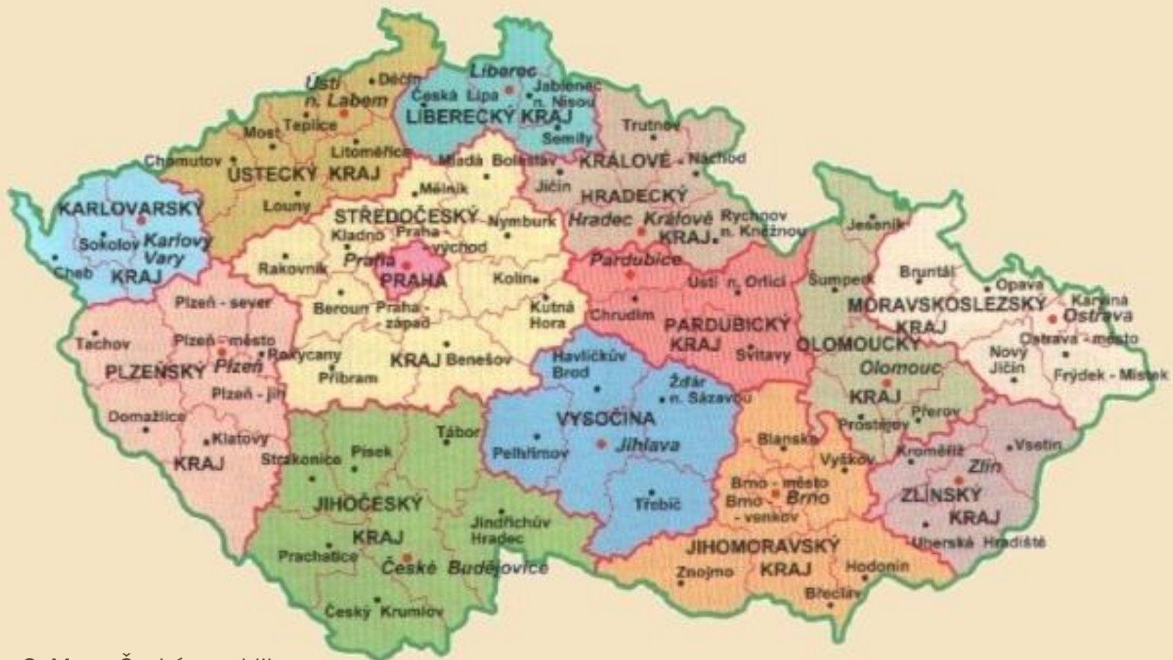
Obr. 2: Mapa České republiky