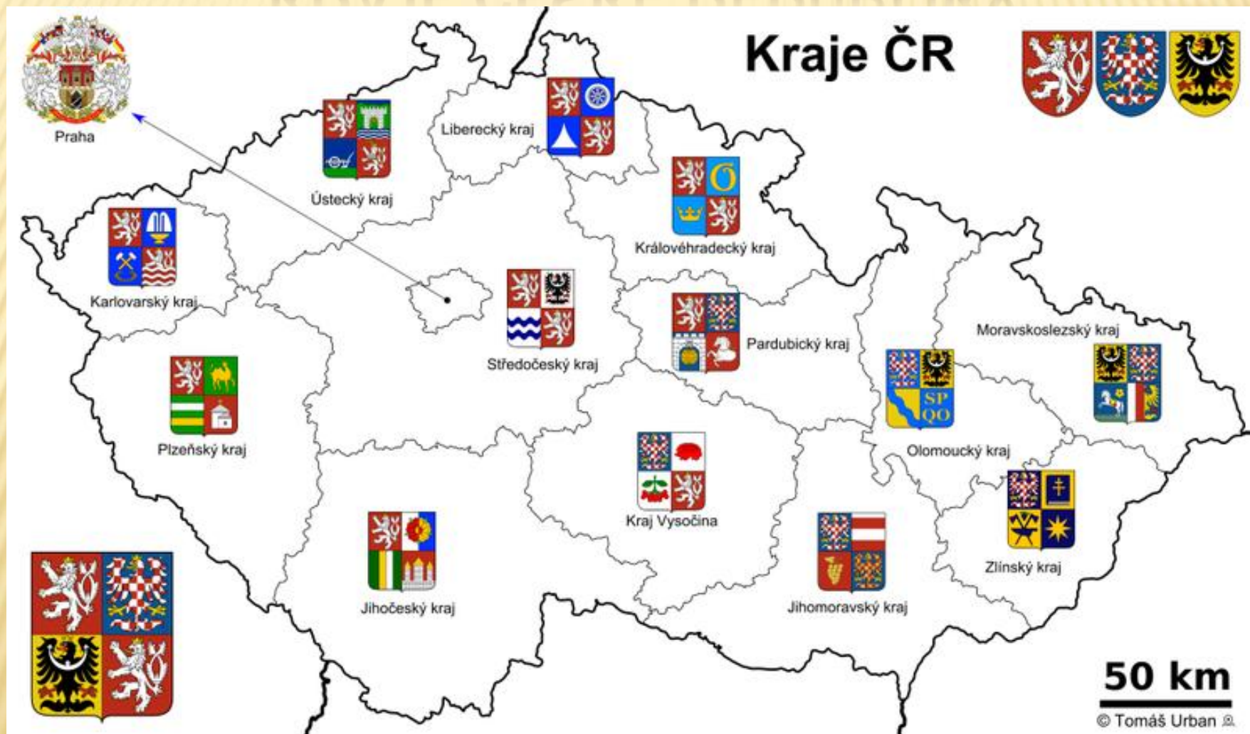
Obr. 3: Mapa krajů České republiky