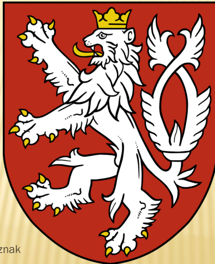
Obr. 6: Malý státní znak