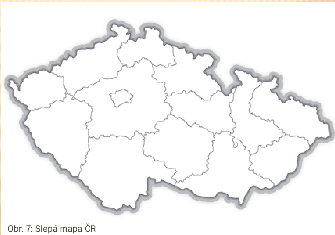
Obr. 7: Slepá mapa ČR