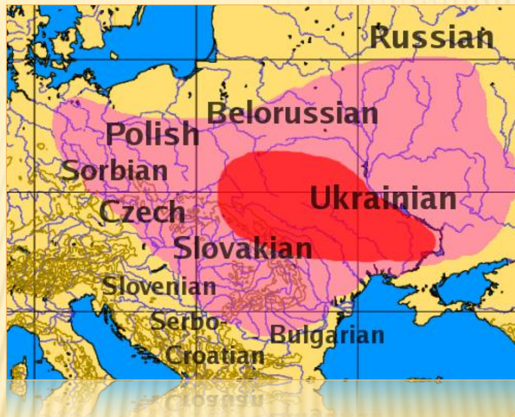
Obr.1: Rozšíření Slovanů, červeně je vyznačena předpokládaná pravlast.