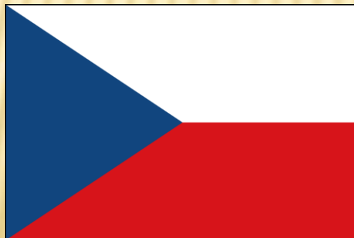
Obr. 3: Vlajka ČSR a současná vlajka ČR